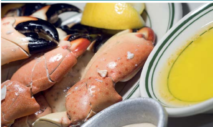
Floryda słynie z owoców morza