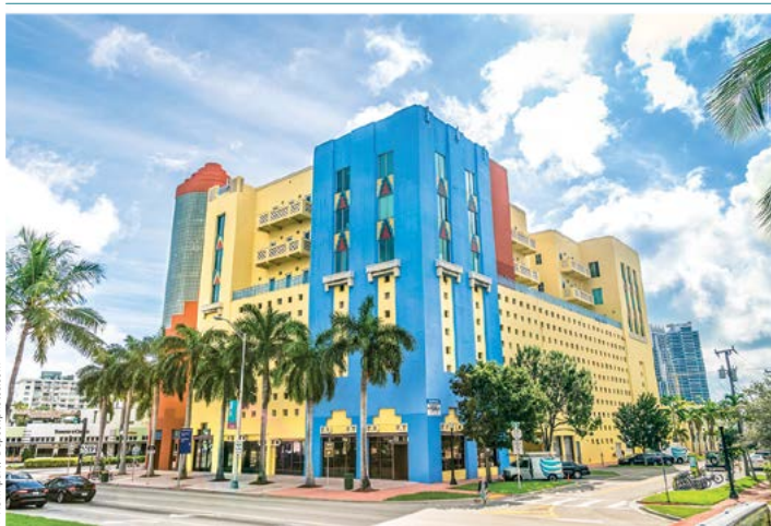
Washington Avenue – budynek w stylu art déco

Budynek jest doskonałym przykładem architektury powstałej w okresie przeprowadzonych w latach 30. robót publicznych. Styl ten określa się